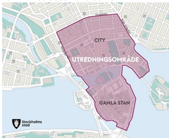
Steg 1 som kommunicerades 2023-10-10